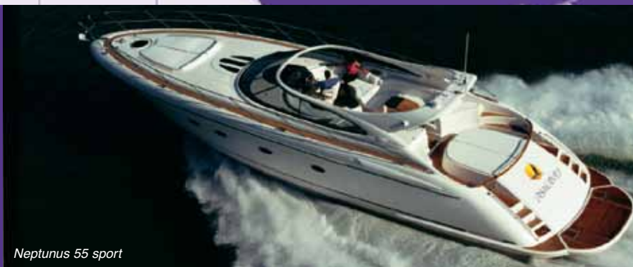
Neptunus 55 sport