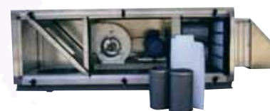
Luchtbehandelings-units op maat of standaard Airhandling units custom-made or standard sizes