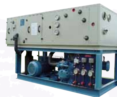
Zeewater-gekoelde package units Seawater-cooled package units