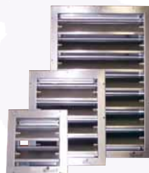
Windex Klaproosters van RVS in iedere gewenste afmeting. Windex RVS Air Grilles custom made in any size.